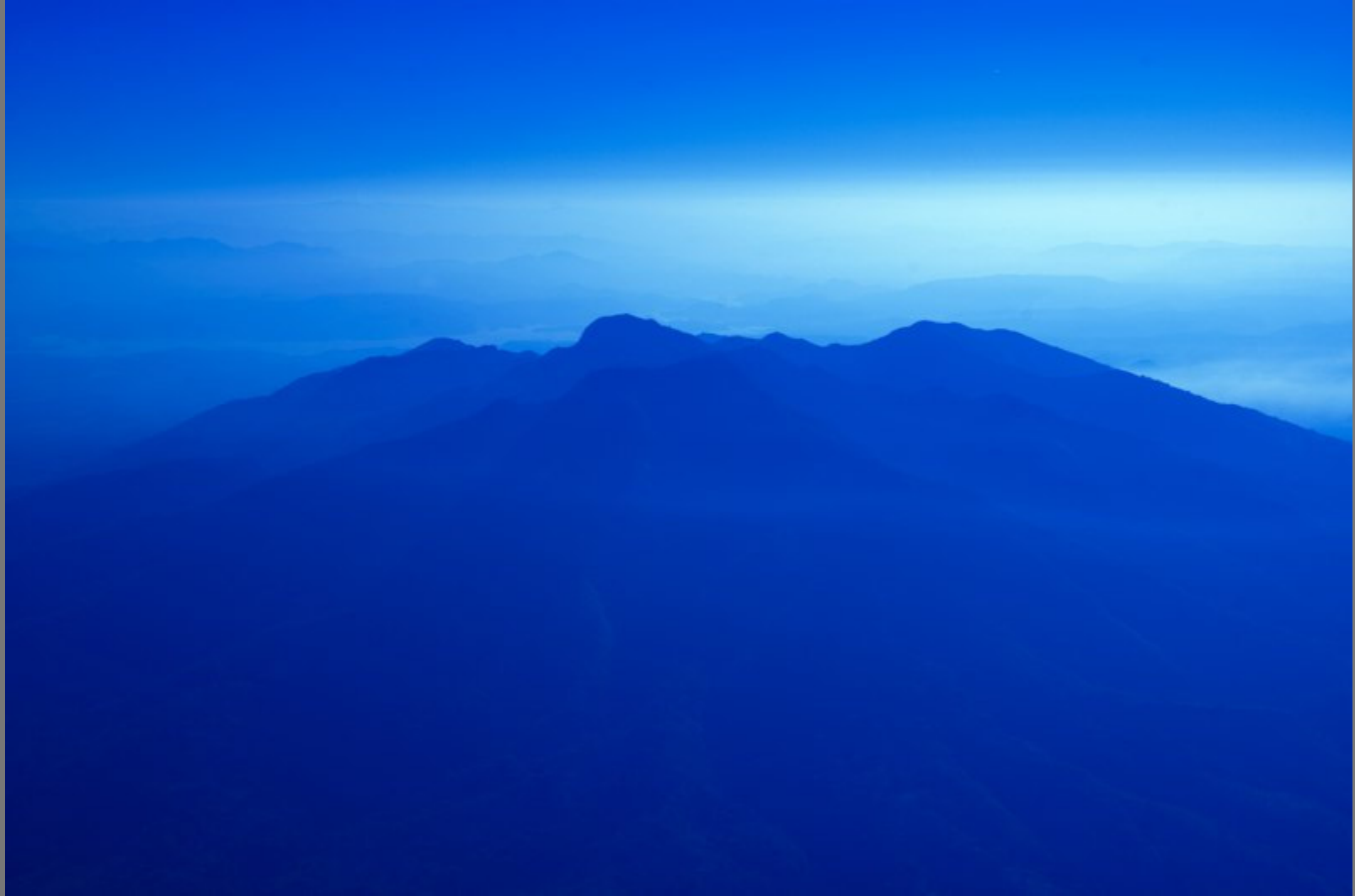
Vista desde Chalatenango hacia lago Suchitlan (cerrón Grande