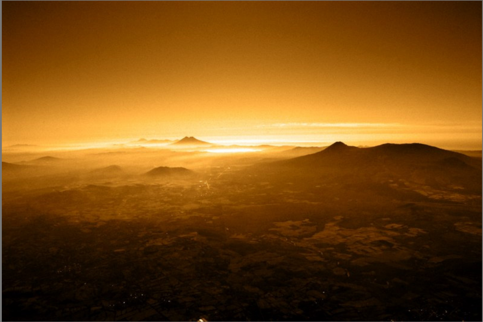
En el horizonte el Volcán Chinchontepeq (San Vicente), a la derecha Volcán San Salvador. Vista de occidente a oriente