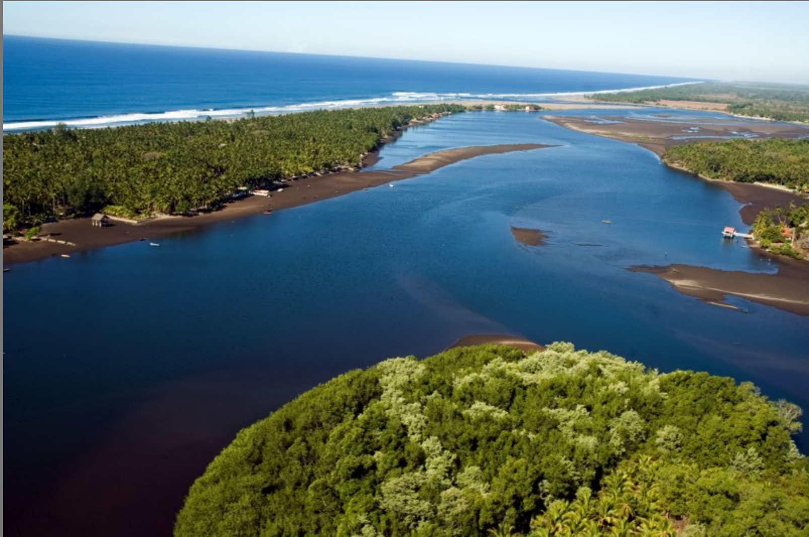
Bocana de la Barra de Santiago (Ahuachapan)