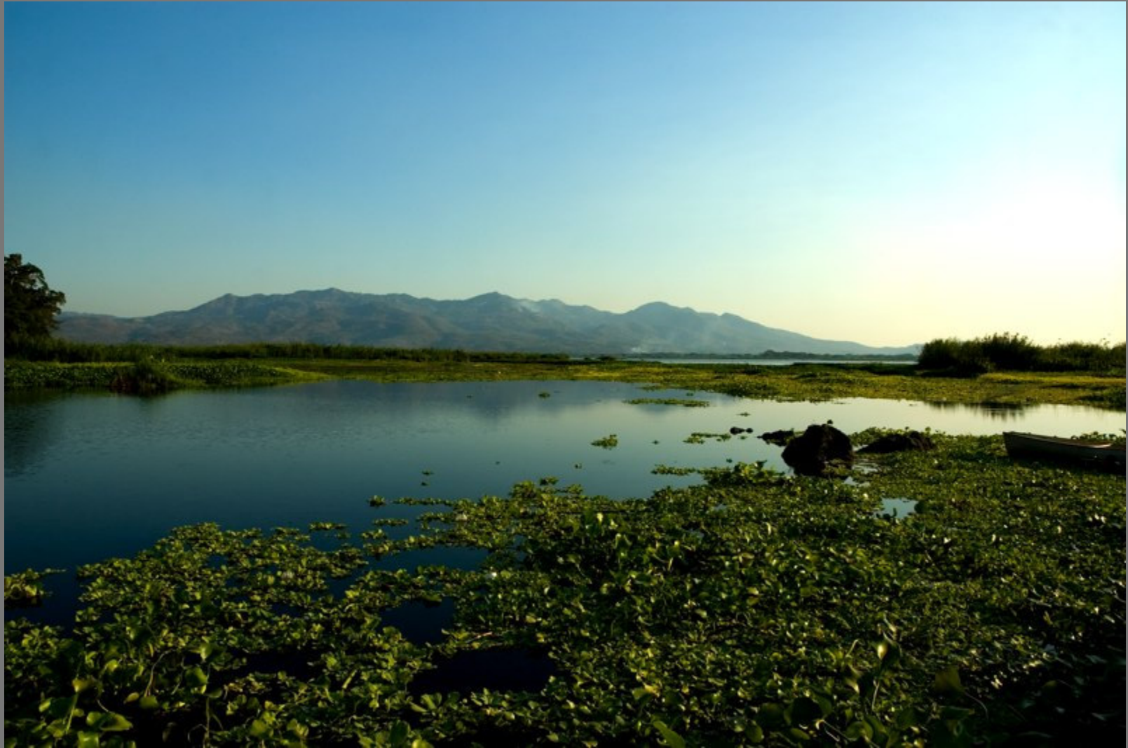
Laguna de Olomega