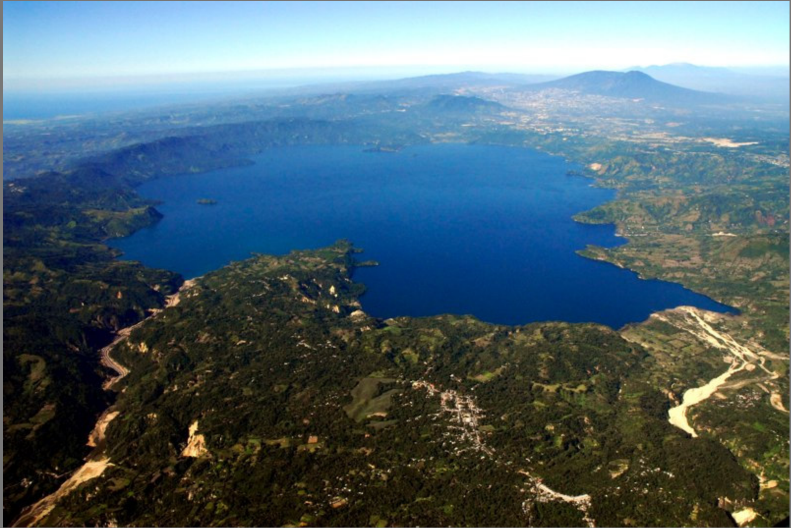
Lago de Ilopango. Vista desde Cojutepeque