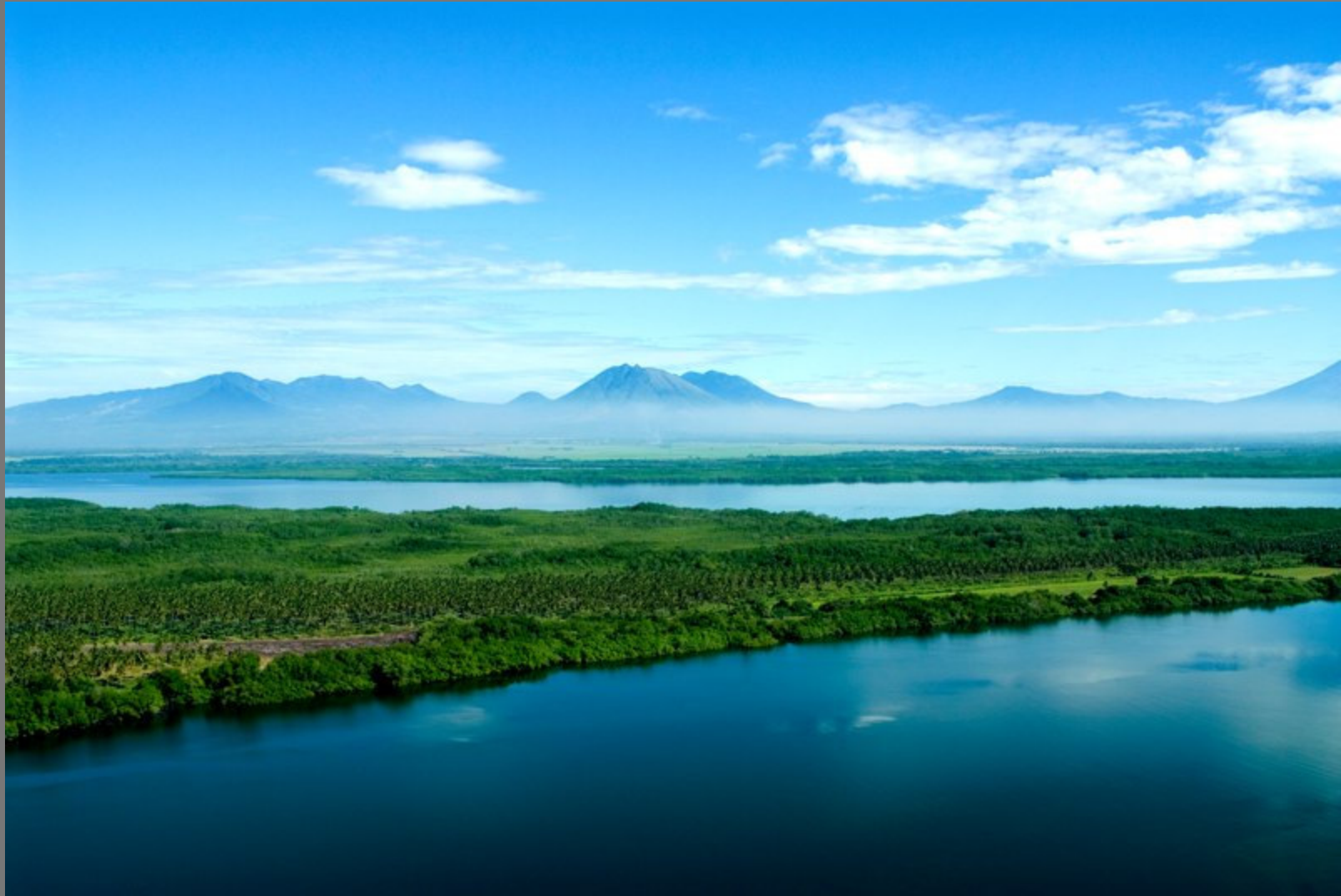
Bahía de Jiquilisco. Punta San Juan del Gozo. Al fondo cordillera volcánica (Volcán de Usulután)