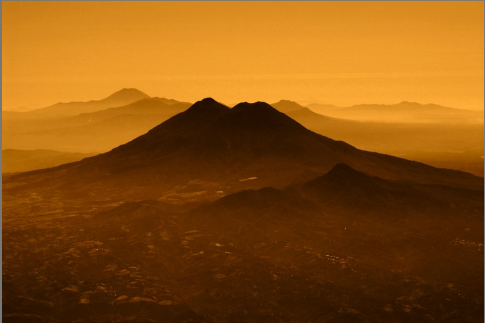
Volcán Chinchontepeq (San Vicente)