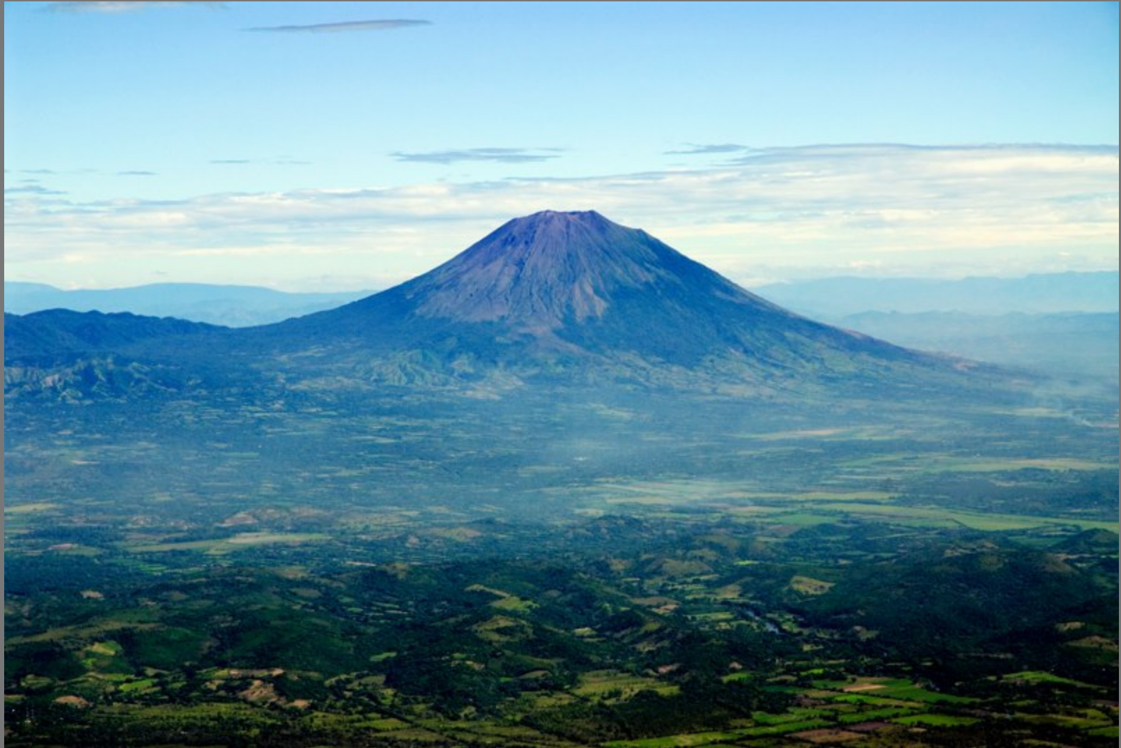
Volcán de Usulután