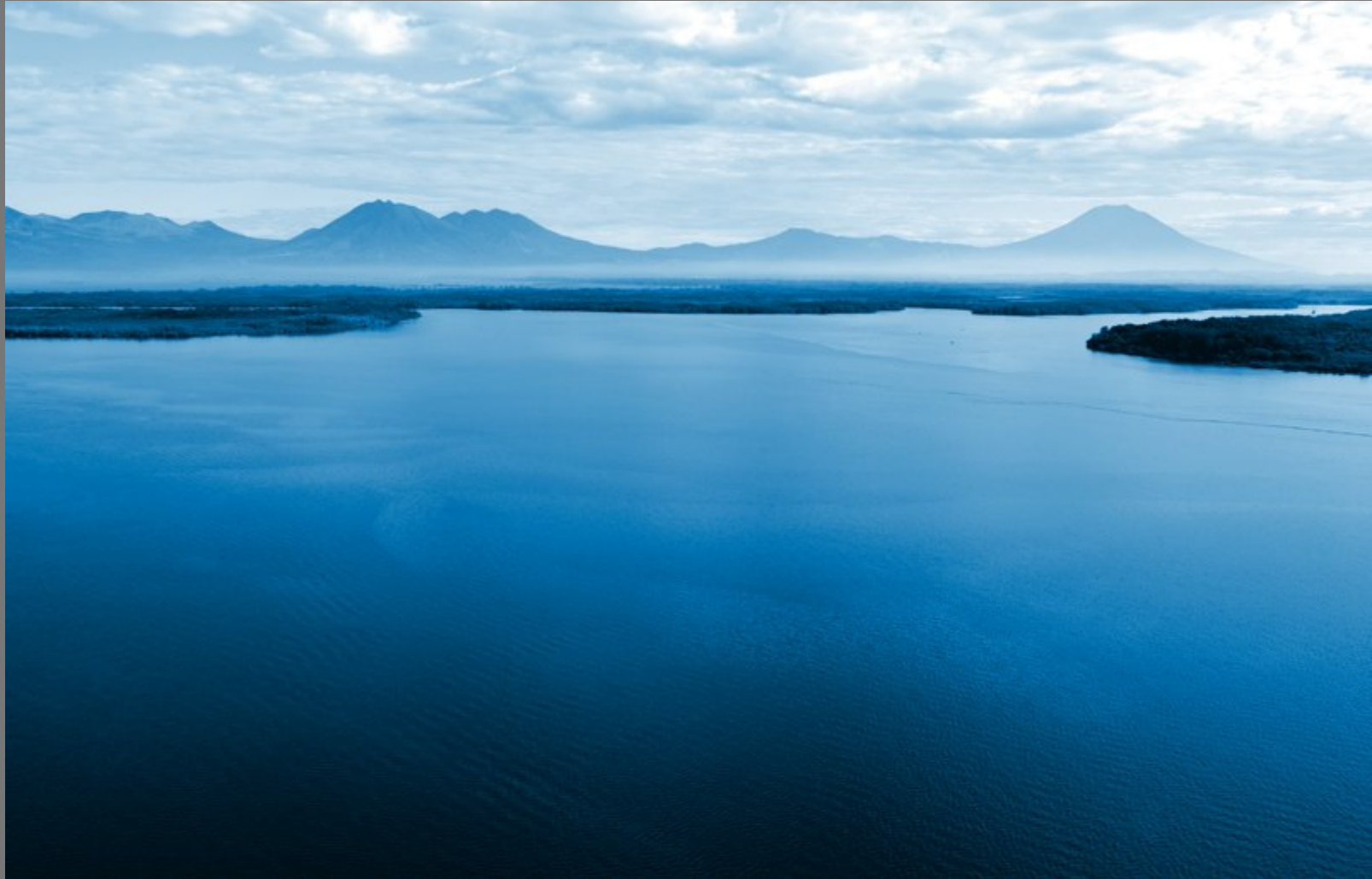
Bahía de Jiquilisco. Al fondo cordillera volcánica (Volcán de Usulután y Chaparrastique)