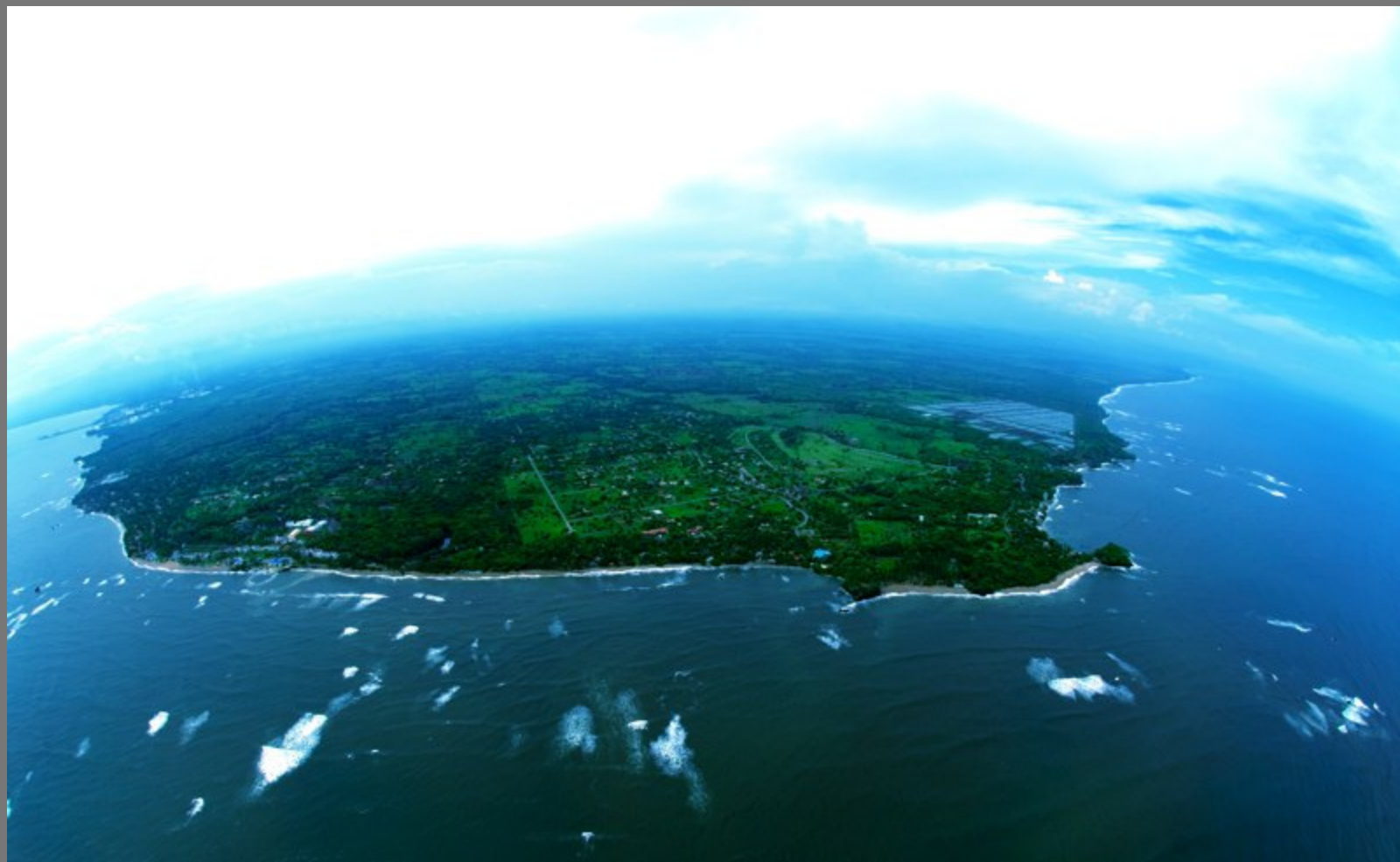
Playa Los Cóbanos. Al fondo-izquierda el puerto Acajutla