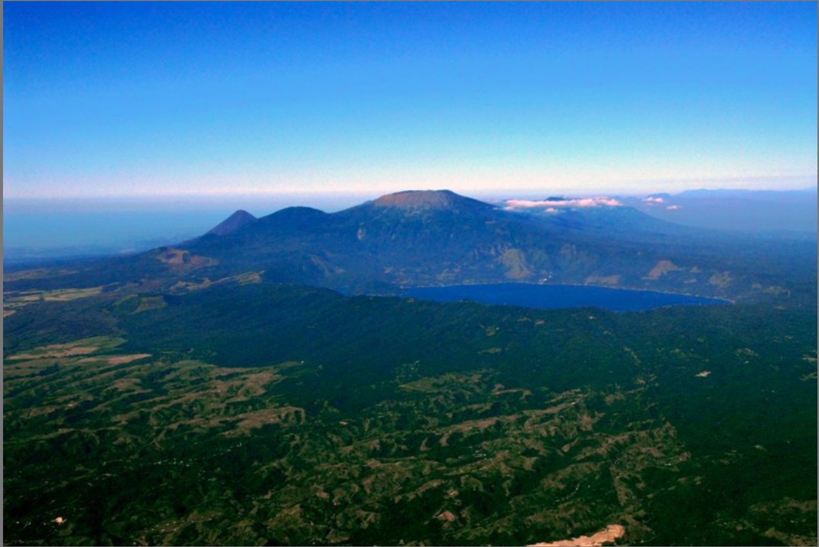
Lago de Coatepeque. Al fondo Volcanes de Santa Ana e Izalco