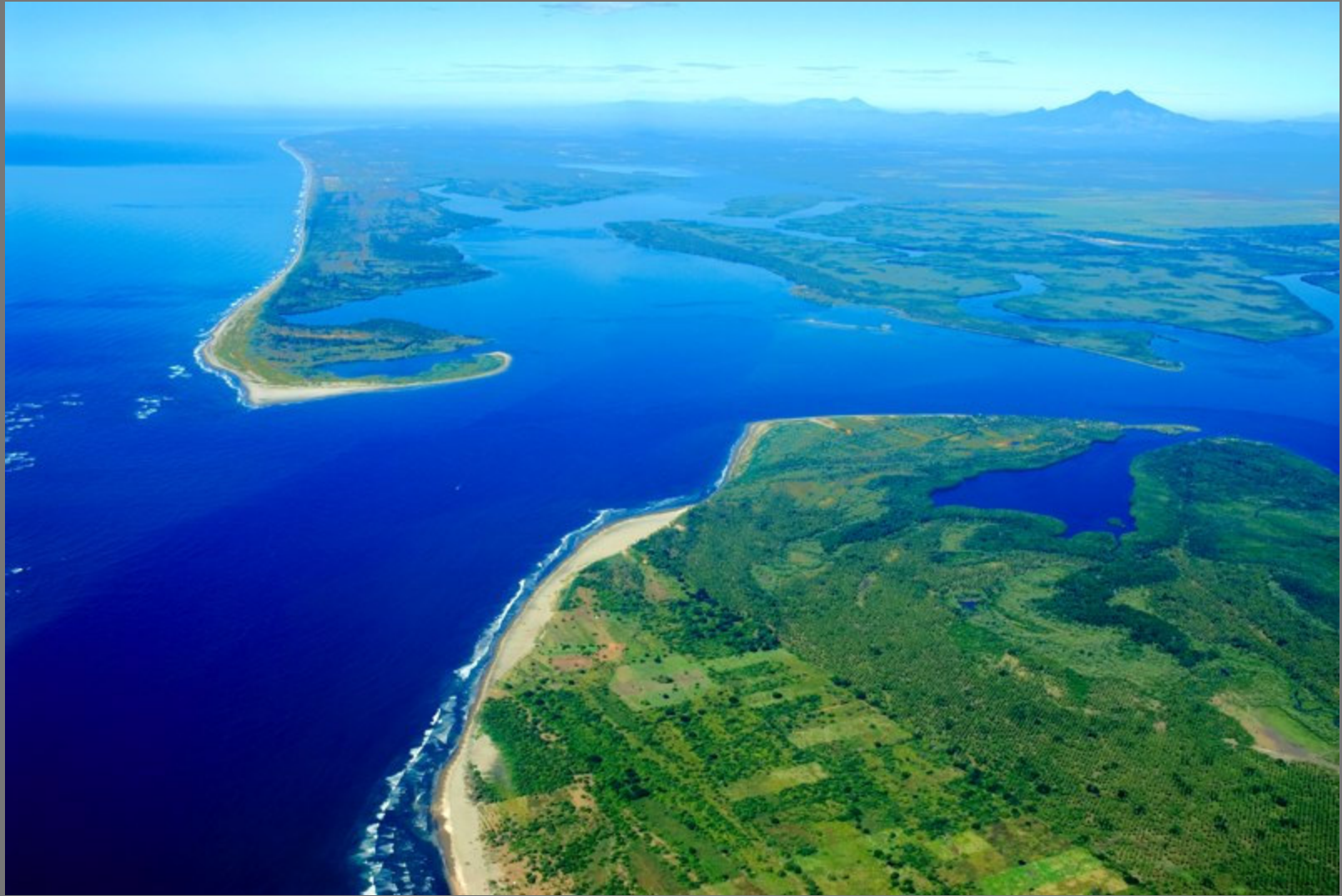
Bocana La Chepona. Al fondo Volcán Chinchontepeq