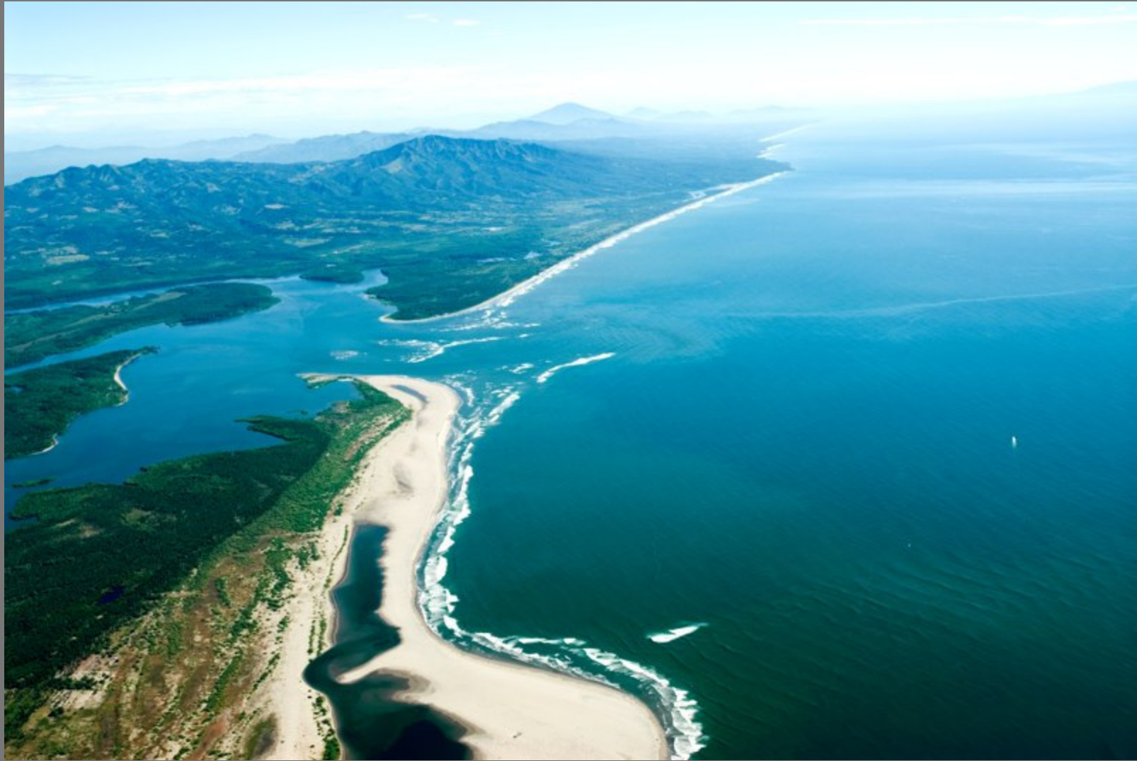
Bocana La Chepona y playa El Espino. Al fondo Cordillera de Jucuarán y Volcán Chinchontepeq