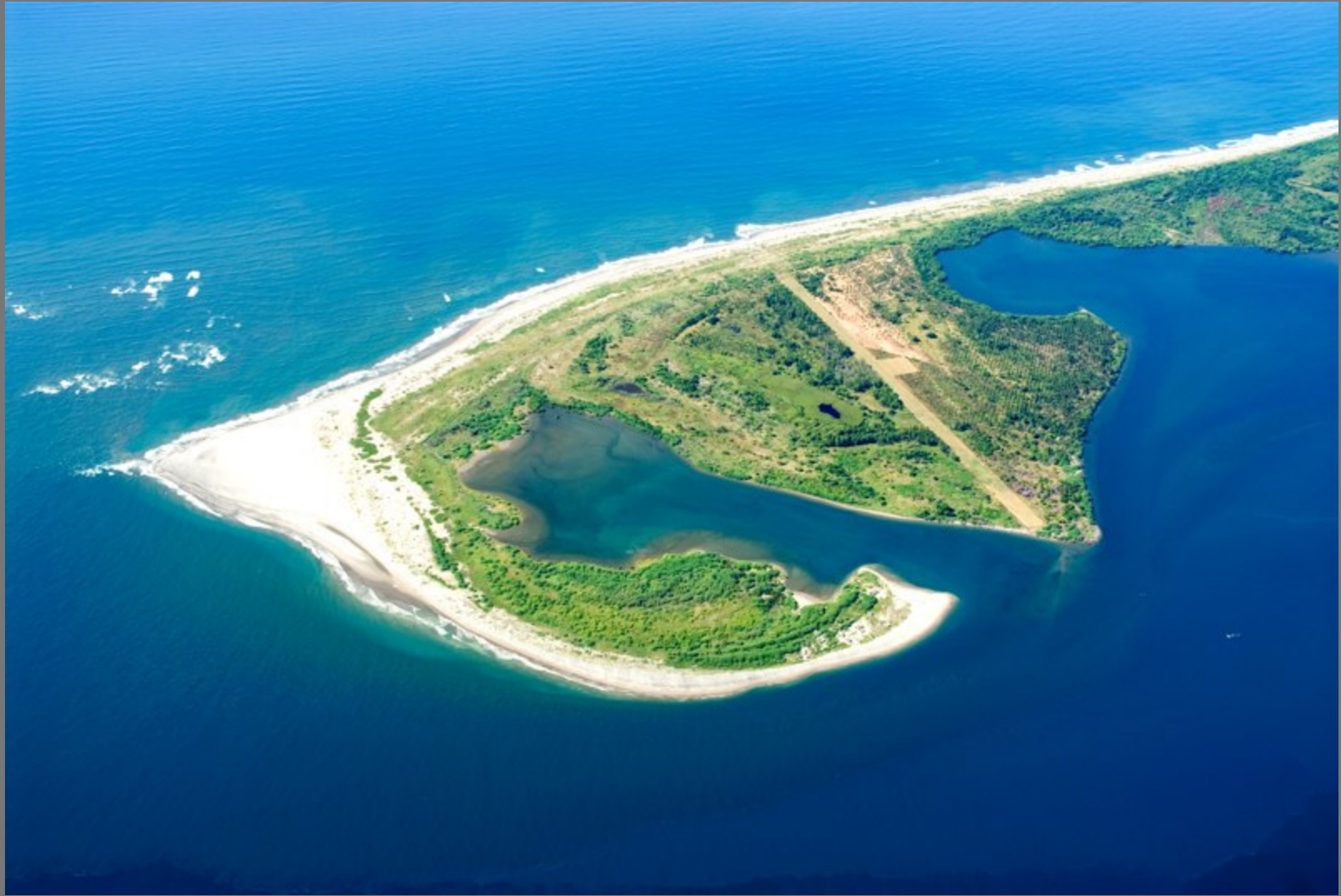
Bocana La Chepona