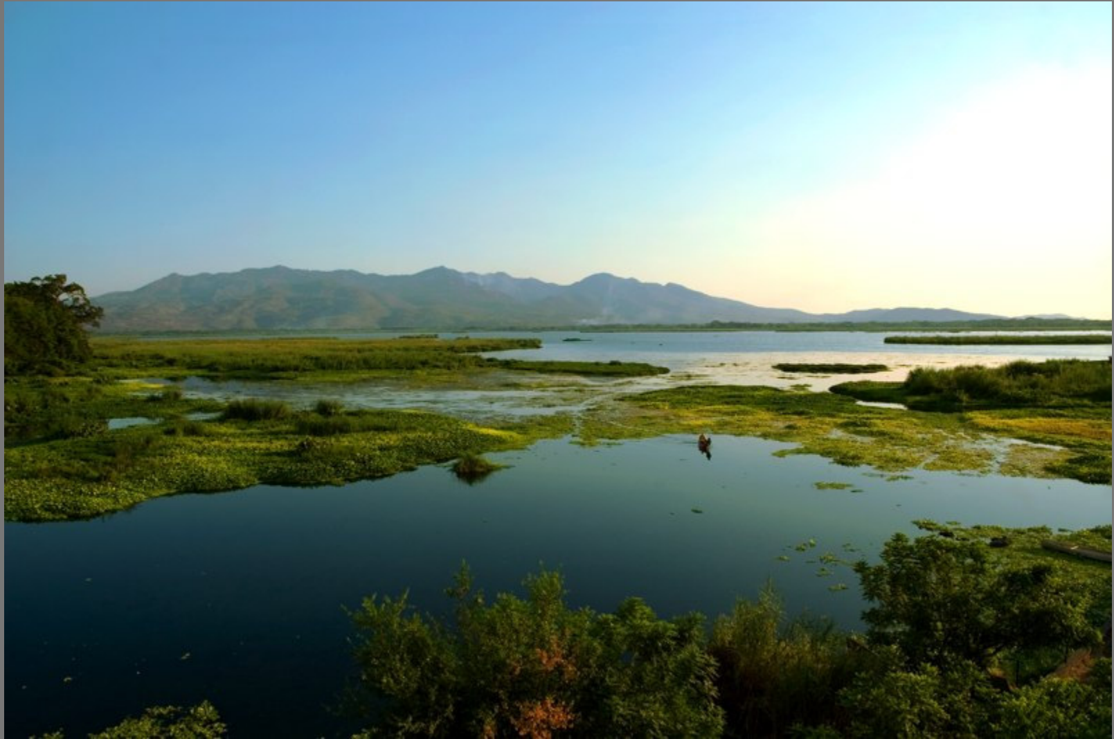
Laguna de Olomega