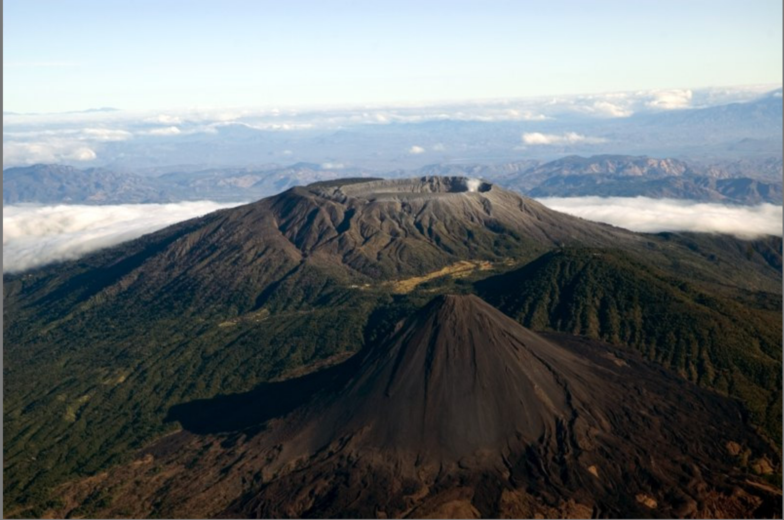
Volcán de Izalco, Volcán de Santa Ana