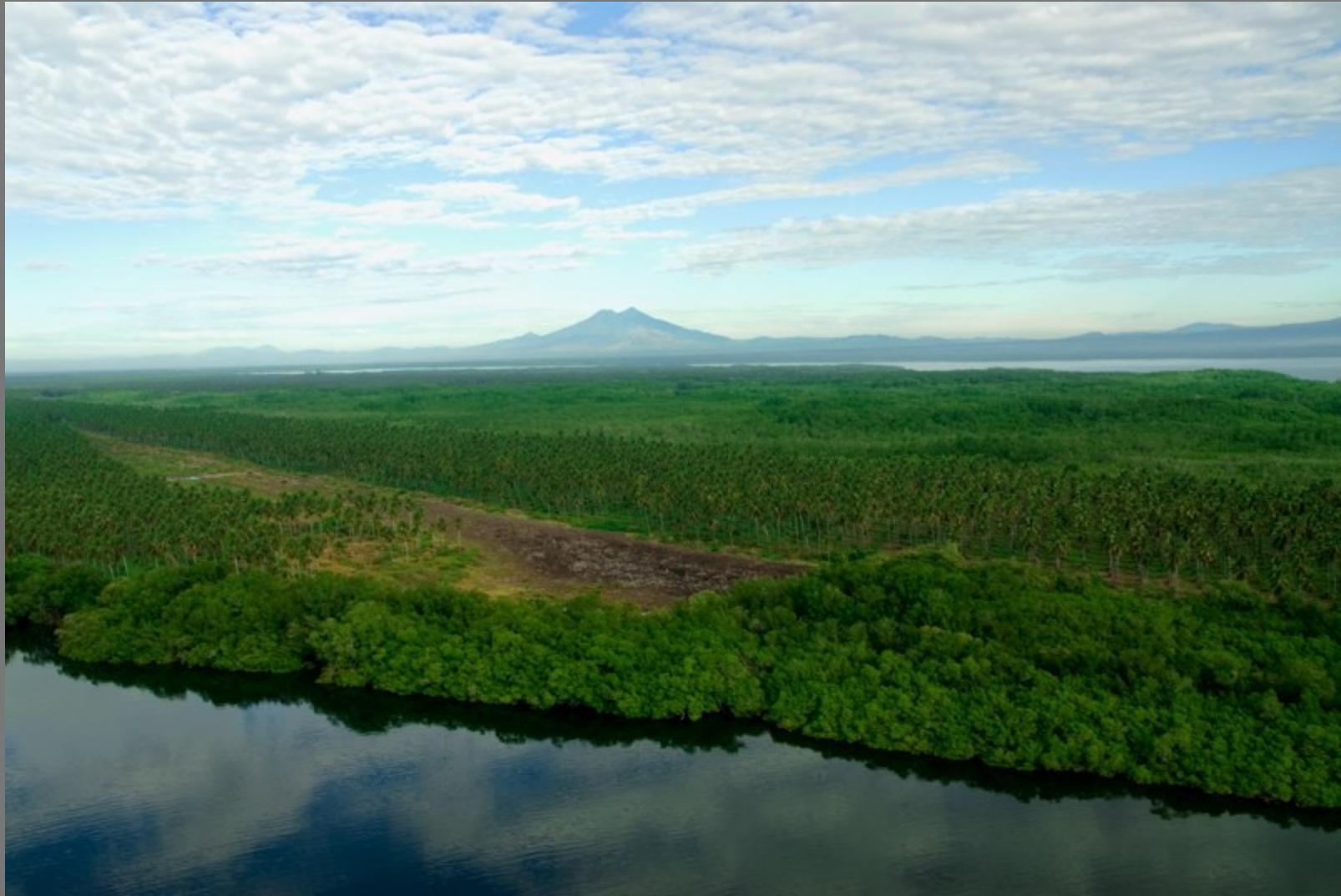
Punta San Juan del Gozo. Al fondo Volcan Chinchontepeq (San Vicente)