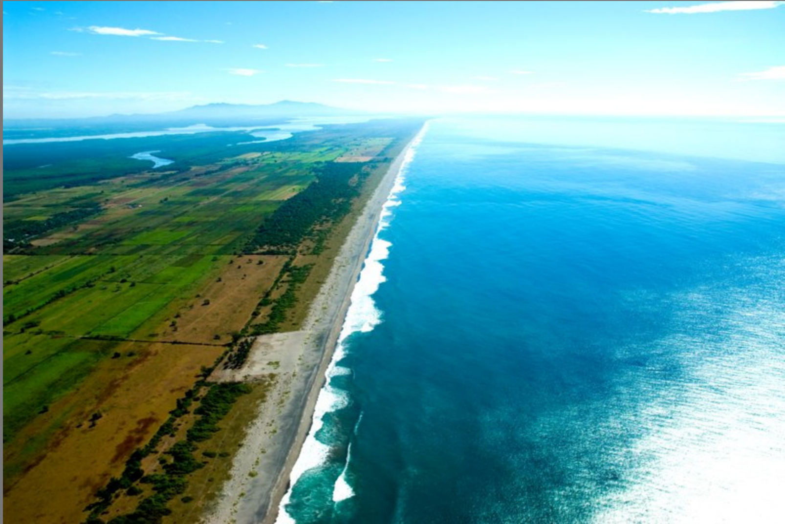
Isla Tasajera (entre Estero de Jaltepeque -La Herradura- y desembocadura del Río Lempa)